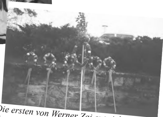
Die ersten von Werner Zai entwickelten Palm- bäumchengestelle von 1988 waren bis letztes Jahr (2025!!!) im Einsatz!