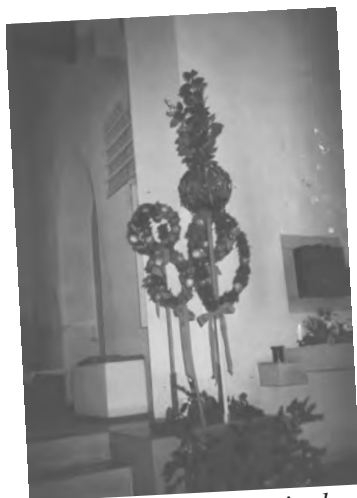
Grosse Palmbäume in der Kirche 1988 – noch vor der Renovation von 1993. Der Tabernakel rechts im Hinter- grund steht heute in der Un- terkirche, in der Oberkirche befindet sich dort jetzt die Statue des Stephanus.