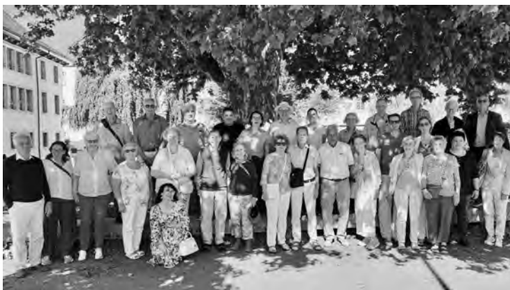
Gruppenfoto Pfarreireise Kloster Muri am 14. Juni 2026

Nachtrag: Die Benediktinermönche haben sich nach der Klosteraufhebung in Sarnen und im Südtirol (Kloster Muri-Gries) niedergelassen. Die Habsburger, nach der Schenkung noch als Schirmherren eingesetzt, wurden im Jahr 1415 endgültig vertrieben. Sie haben aber bis heute die Verbindung zum Kloster Muri beibehalten und besuchen jährlich die Grabstätten ihrer