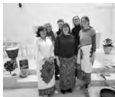
Männedorf 2025 Uetikon 2025 WGT-Team Männedorf und Uetikon 2026