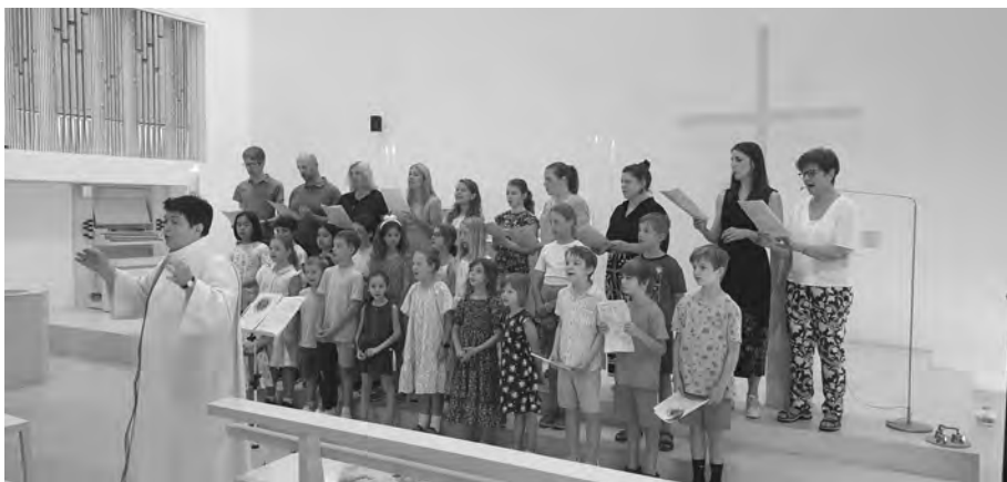
Der Ad-hoc-Kinder-Eltern-Erwachsenen-Chor mit Kinderchor am 31. Mai

044 790 11 24 oder per Mail an b.ulsamer@kath-maennedorf-uetikon.ch