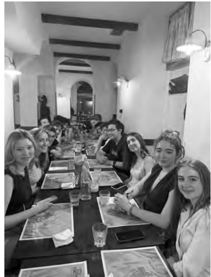
Gemeinsames Abendessen in Trastevere

Natürlich durfte auch der Petersdom nicht fehlen. Der prachtvolle Kirchenraum beeindruckte alle zutiefst. Ein besonderes Erlebnis war der Aufstieg auf die Kuppel, von der aus wir einen herrlichen Blick über Rom und den Petersplatz geniessen konnten. Für viele war dies ein schöner und beeindruckender Moment der Reise.