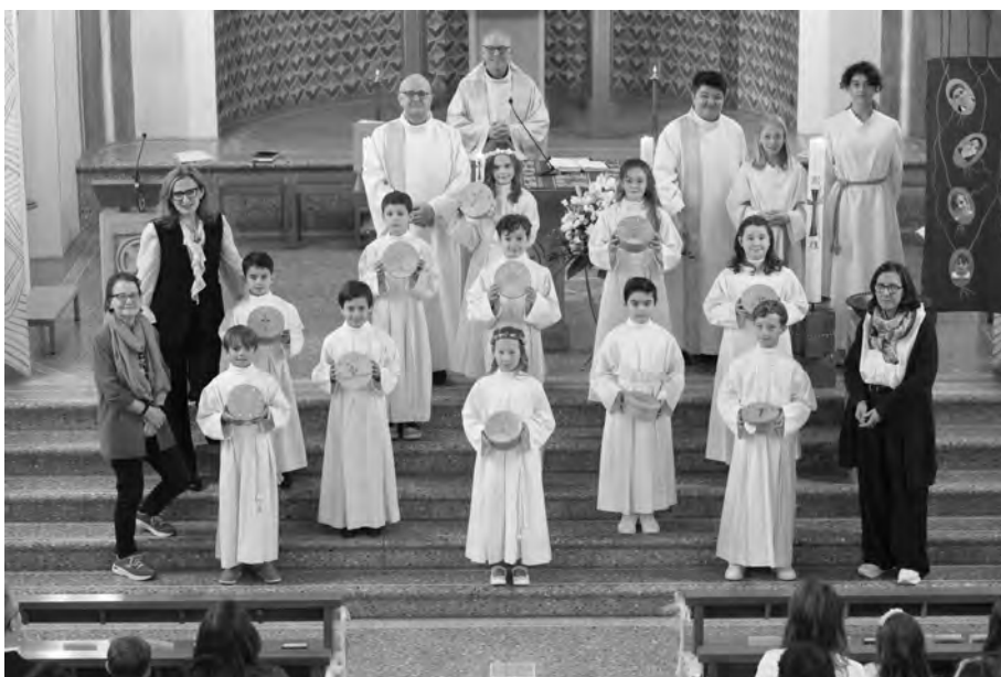
Erstkommunionkinder aus Uetikon am Sonntag um 11 Uhr