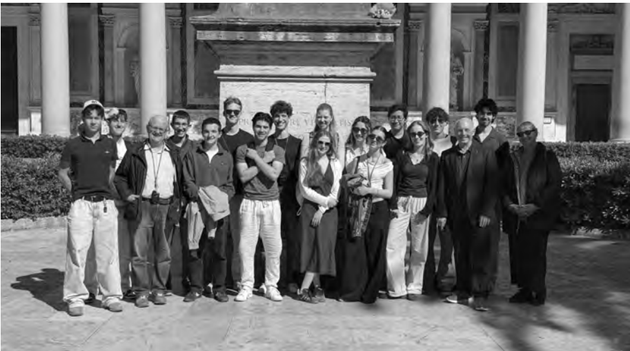
Die ganze Gruppe in Sankt Paul vor den Mauern zu Füßen der Paulusstatue