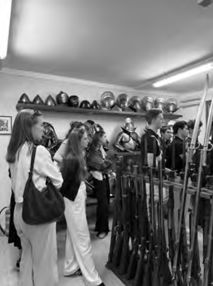
In der Waffenkammer der Schweizergarde

men und die Waffenkammer beeindruckten die Jugendlichen sehr. Auch der Stadtteil Trastevere begeisterte uns. Mit seinen schmucken Gassen, kleinen Plätzen und