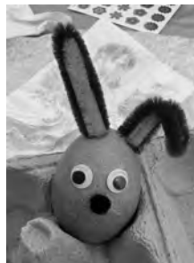
Fotos vom Osterbasteln in der Jugendlounge