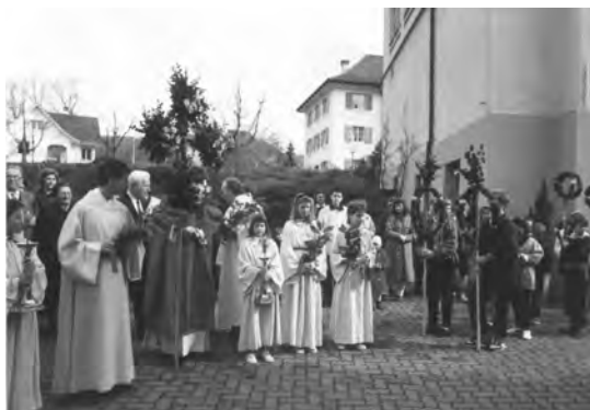
Segnung der Palmbäumchen 1989 zwischen Pfarreizentrum und Kirche, dort, wo heute der Pizzeria steht.