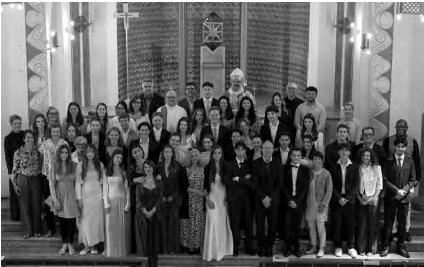
Neugefirmtete mit Patinnen und Paten, Firmteam und Firmspender am Samstag, 13. Juni 2026