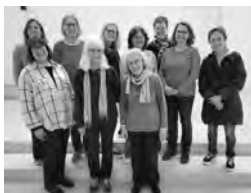
WGT-Team 2026 mit Chor- Frauen