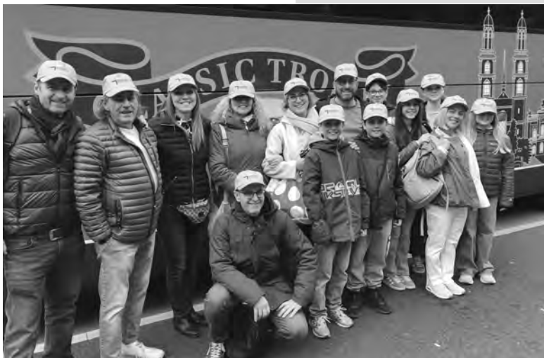
Gita delle famiglie a Zurigo

Lunedì 7 settembre, alle ore 20.00, nella chiesa di Hombrech- tikon avrà luogo l'adorazione