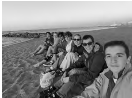
Auch ein Ausflug zum Meer hatte noch Platz

Sehr beeindruckend waren zudem die Besichtigungen der Katakomben der Domitilla sowie der Vatikanischen Nekropole mit dem Grab des Heiligen Petrus. Diese Orte vermittelten auf eindrucksvol-