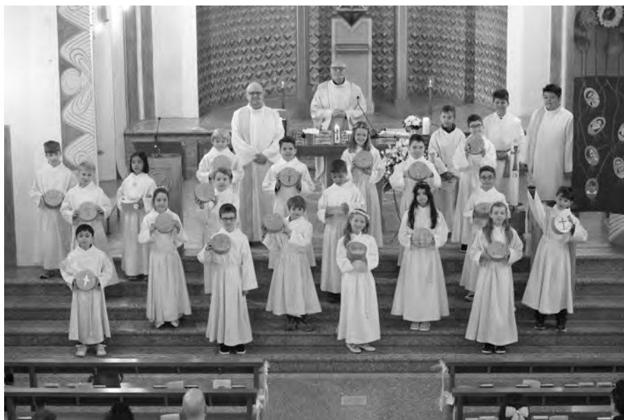
Erstkommunionkinder aus Männedorf am Sonntag um 9 Uhr