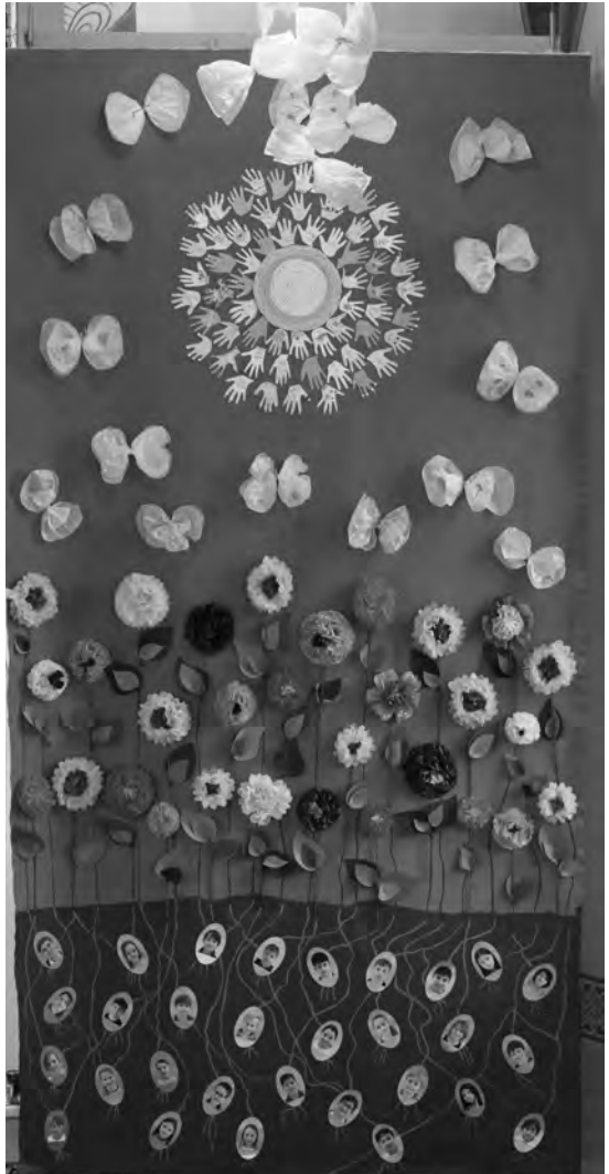
Gelungenes Erstkommunionbild zum Thema "Mit Jesus auf Schatzsuche"