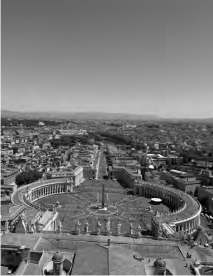
Blick von der Kuppel des Petersdoms auf den Petersplatz

Unsere Reise nach Rom war für alle Teilnehmenden ein besonderes Erlebnis. Gemeinsam mit Jugendlichen und jungen Erwachsenen verbrachten wir eindrucksvolle Tage voller Gemeinschaft, Kultur und unvergesslicher Momente. Schon bei der Ankunft war die Vorfreude gross, die Ewige Stadt mit ihren weltberühmten Sehenswürdigkeiten zu entdecken.