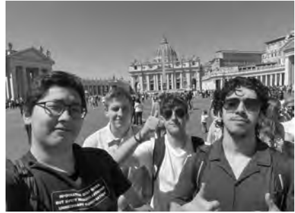
Cooler Jungs auf dem Petersplatz

Ganz besonders faszinierte uns auch das Pantheon und das Forum Romanum. Vor allem die beeindruckende Architektur des Pantheons liess viele staunen. Die gewaltige Kuppel, das harmonische Zusammenspiel der Proportionen und die Baukunst der Antike machten dieses Bauwerk für viele zu einem Höhepunkt der Reise. Auch das Forum