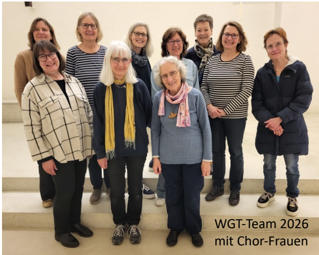
WGT-Team 2026 mit Chor-Frauen