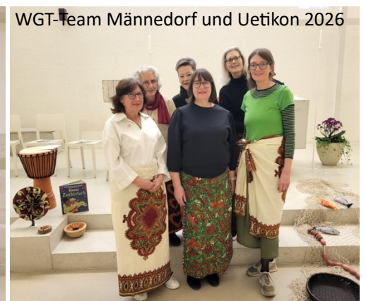
WGT-Team Männedorf und Uetikon 2026